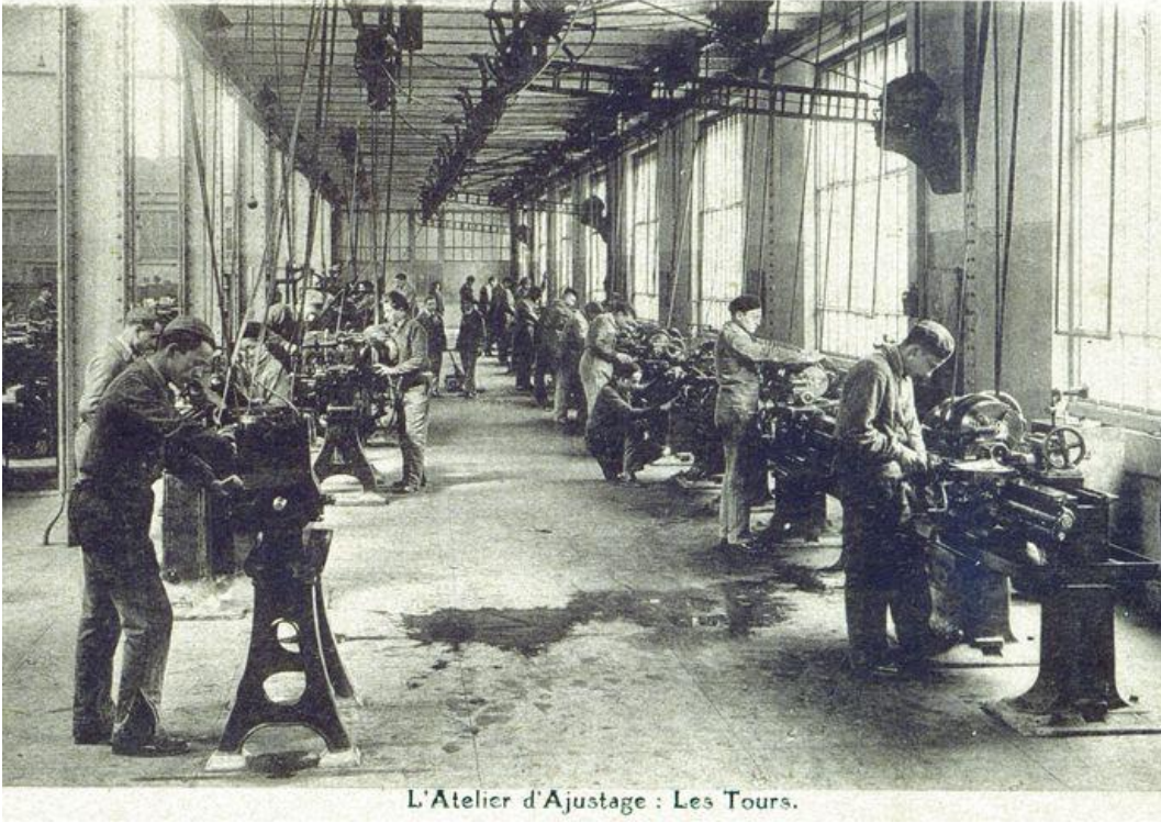
L'Atelier d'Ajustage : Les Tours.